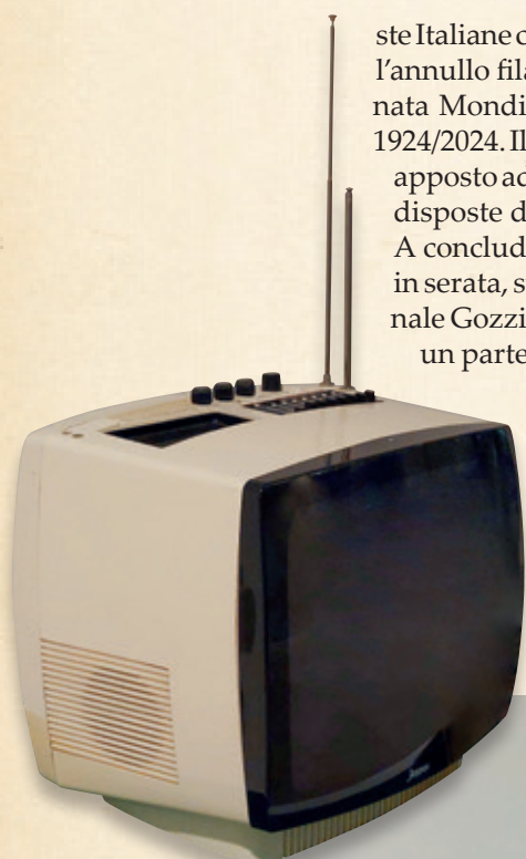
Al centro a sinistra: ZOPPAS mod. Z 121 Italia - 1974