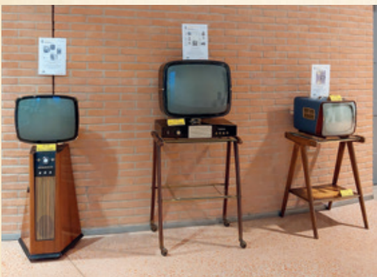
Al centro: VOXSON mod. T 1228 "Oyster" Italia - 1975