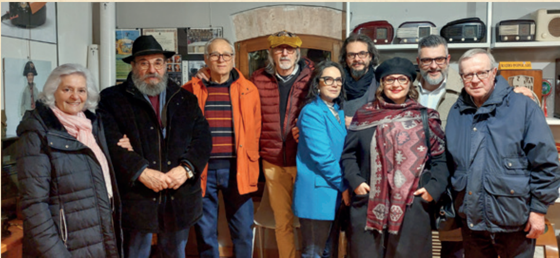
Qui a lato: simpatica foto ricordo scattata durante la visita all'esposizione delle radio del Museo.