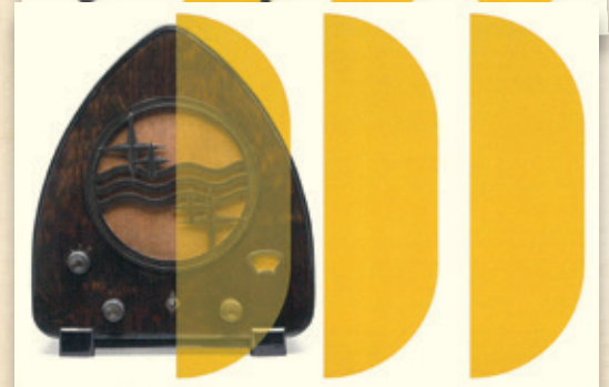
Sopra: la prima serie di quattro cartoline pubblicata dal MIRS con l'annullo postale.