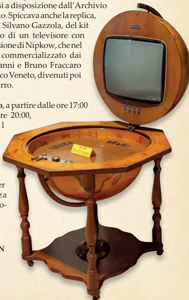
WUNDERSEN mod. MP 20 Italia - 1969

Il 16 febbraio, a partire dalle ore 17:00 e fino alle ore 20:00, nella hall d'ingresso del Teatro Comunale Gozzi, è stato convocato per la ricorrenza l'Ufficio di Po-